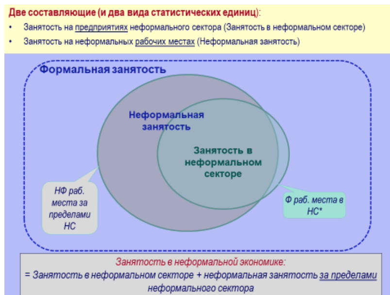
Рисунок 2. Занятость в неформальном секторе

Примечание: НФ – неформальные; Ф – формальные; НС – неформальный сектор.