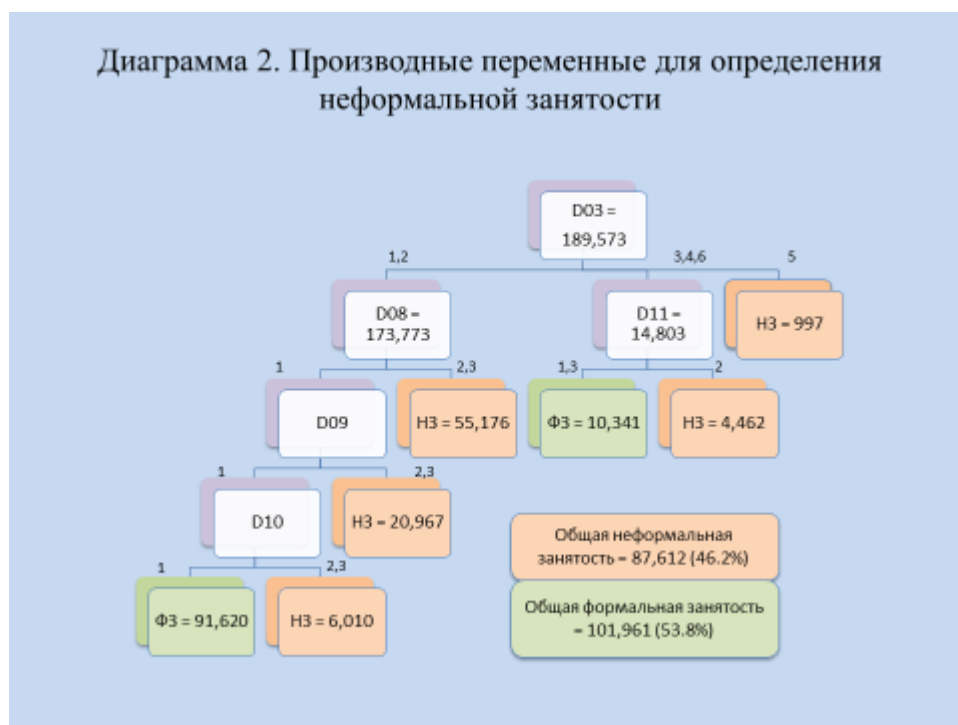
Диаграмма 2. Производные переменные для определения неформальной занятости

Вопрос D03. Респондентам, которые при ответе на вопрос D03 выбрали вариант 1 или 2, последовательно задаются вопросы с D04 по D08. Респонденты, которые выбрали вариант 3, 4, 6, переходят к вопросу D11. Респонденты, которые выбрали вариант 5, являются неформально занятыми.