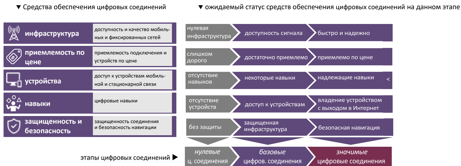
Рисунок 3: Ожидаемый статус средств обеспечения цифровых соединений по этапам их развития

на этапе значимых цифровых соединений инфраструктура будет быстрой и надежной для всех; каждый будет владеть интеллектуальным устройством. Для повышения качества цифровых соединений необходимо достичь определенного порога производительности по каждому из этих факторов, поскольку каждый из них представляет собой обязательное ограничение: без инфраструктуры цифровые соединения невозможны; никто не захочет подключаться, если это будет непомерно дорого; без устройства подключиться невозможно; подключение возможно, но опасно в незащищенном виде. Точно так же не может быть значимых цифровых соединений без совершенствования всех средств ее обеспечения. Если страна полностью игнорирует, например, цифровую грамотность, способность ее населения эффективно использовать возможности цифровых соединений будет безвозвратно утрачена, даже если все остальные факторы будут в порядке.