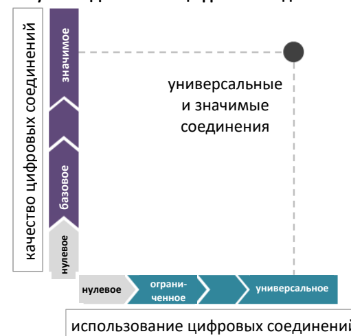
Рисунок 1: Два аспекта цифровых соединений

«Универсальные цифровые соединения» означают цифровые соединения для всех. «Значимые цифровые соединения» — это уровень соединений, который позволяет пользователям получать безопасный, удовлетворительный, обогащающий и продуктивный онлайн-опыт по приемлемой цене. Эти два аспекта дополняют друг друга: ни универсальные цифровые соединения низкого качества, ни значимые цифровые соединения для немногих не принесут значительных выгод для всего общества. Одновременно с этим сотрудники и участники нескольких вебинаров, на которых была представлена работа РПГ, также предоставили свои отзывы и предложения.