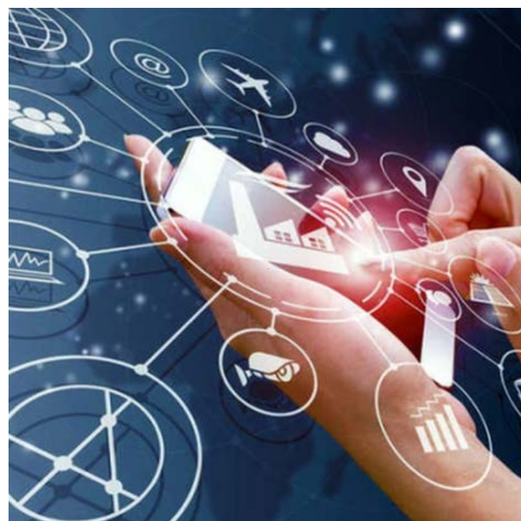
Ресурсы адресной системы