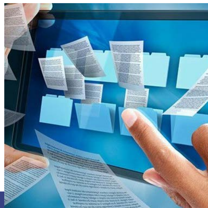
Регистр стоимости земель, земельных участков