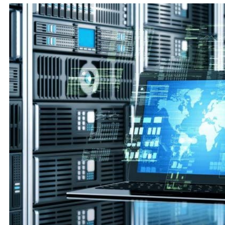
Единый реестр имущества